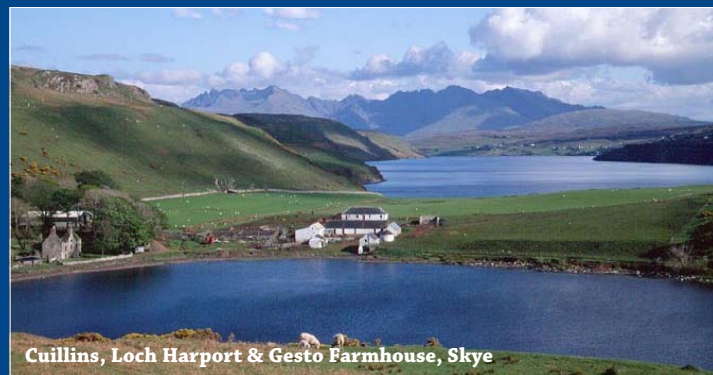
Cuillins, Loch Harport & Gesto Farmhouse, Skye